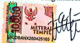
Yomartus Karo Gago

Ende, 21 Januari 2026 Yang membuat pernyataan